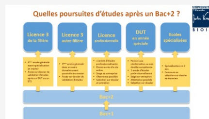
Que faire après un Bac+2 ?