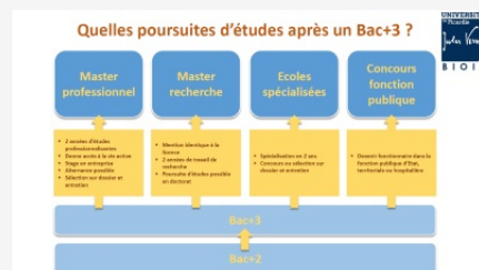
Que faire après un Bac+3 ?