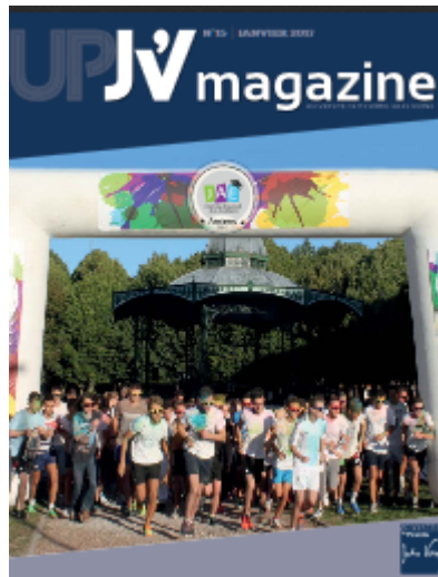
JV magazine n°15 Janvier 2017