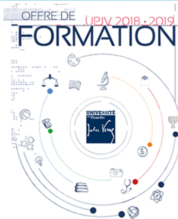
Offre de formation UPJV LMD, DUT, Licences Pro