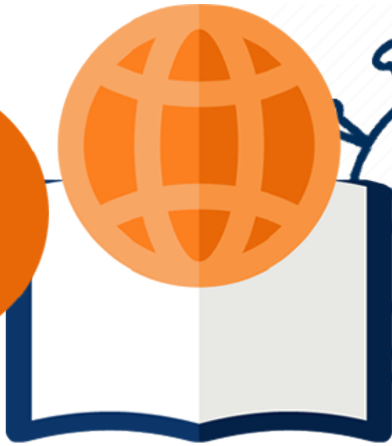
Cours de FLE