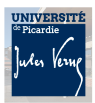
utilisation du logotype bleu sur fond image clair