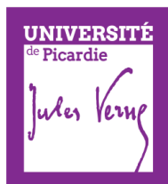
utilisation du logotype en réserve blanche sur fond foncé