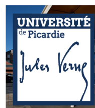
Sur fond ne permettant pas une bonne lisibilité du logotype ajouter une cartouche bleue espace de 1 mm protégé du logotype blanc

Le logotype en réserve blanche permet d'avoir "de Picardie" et "Jules Verne" en transparence et donc une harmonie