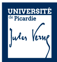
utilisation du logotype en réserve blanche sur fond bleu