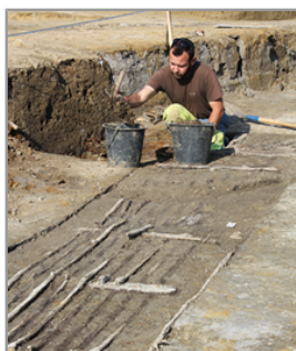
Fouilles et suivis archéo