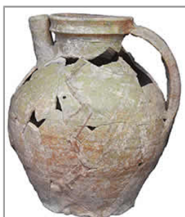
Étude du mobilier