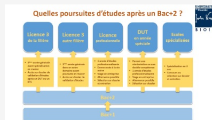
Que faire après un Bac+2 ?