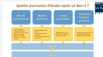
Que faire après un Bac+3 ?