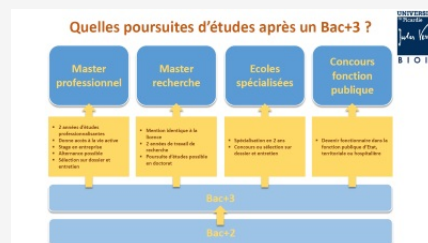
Que faire après un Bac+3 ?