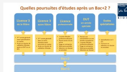
Que faire après un Bac+2 ?