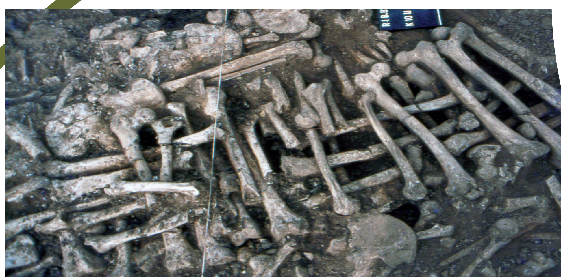
Construction faite d'ossements

Au III e siècle avant notre ère, deux enclos, aménagés à quelques années d'intervalle, témoignent des premières activités à caractère rituel sur le site. Ils diffèrent par leur forme, leur histoire et leur nature.