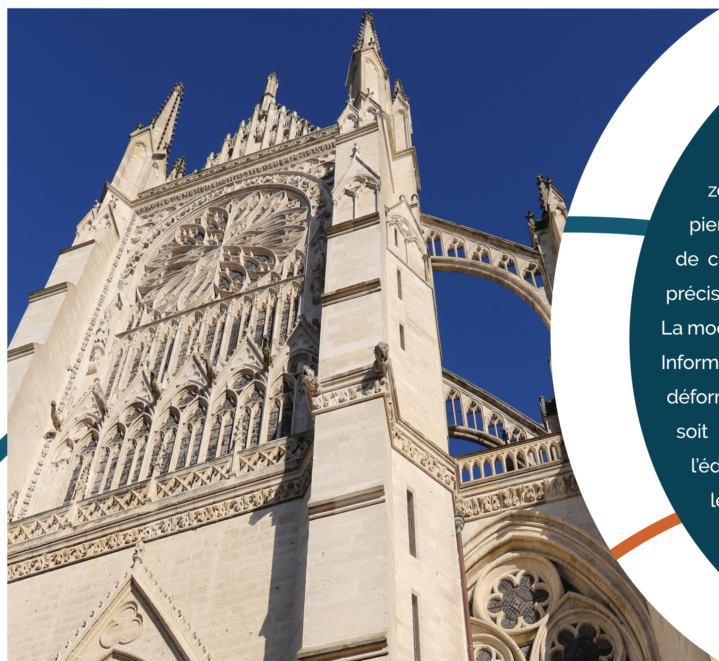
Amiens, cathédrale Notre-Dame, façade du portail sud

Le bras sud du transept est une partie complexe de la cathédrale. Les technologies de pointe permettent aujourd'hui une approche inédite du bâtiment et ouvrent de nouvelles réflexions sur sa construction.