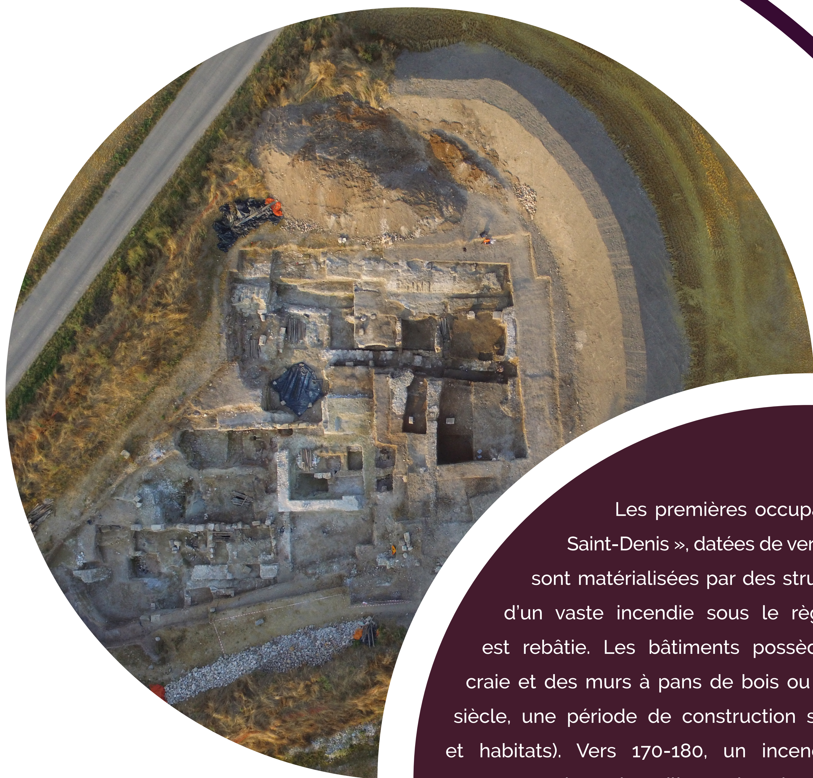
Vue aérienne de la fouille programmée de 2018

Les premières occupations de la « Vallée Saint-Denis », datées de vers la fin du règne d'Auguste, sont matérialisées par des structures sur poteaux. À la suite d'un vaste incendie sous le règne de Claude, l'agglomération est rebâtie. Les bâtiments possèdent des fondations en blocs de craie et des murs à pans de bois ou en moellons calcaires. À la fin du I er siècle, une période de construction s'intensifie ( fana , théâtres, sanctuaires et habitats). Vers 170-180, un incendie ravage l'agglomération dont les traces sont observées ailleurs dans la région. Les reconstructions postérieures en pans de bois et torchis reposant sur des plots de récupération, sont moins denses. Le déclin de l'agglomération s'accélère avec les crises économiques et militaires du III e siècle. Le site est encore largement occupé au IV e siècle. Les indices se raréfient après le début du V e siècle. La fouille d'une nécropole de 250 défunts a permis de signaler l'arrivée de migrants venus d'Europe centrale. L'agglomération de Vendeuil-Caply, bien que sur le déclin, constitue encore un pôle fixateur de l'habitat. Les témoignages des siècles suivants sont sporadiques.