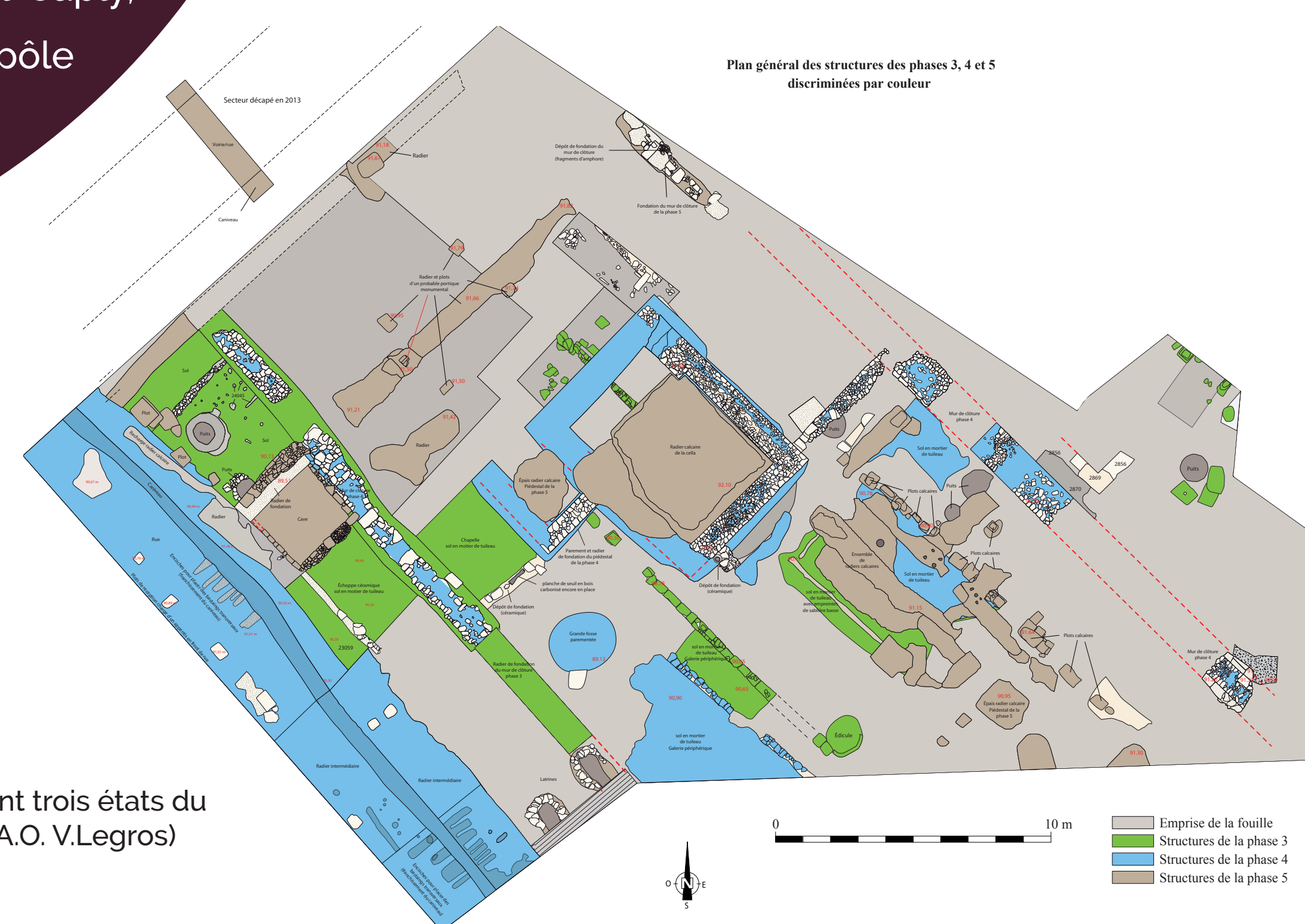
Plan présentant trois états du sanctuaire (D.A.O. V.Legros)

Depuis 2013, la fouille programmée est menée sur un secteur localisé à une centaine de mètres du grand théâtre sur une emprise de 1000 m 2 . Au stade de l'état d'avancement de l'opération, 7 phases chronologiques semblent se définir. Vers la fin du I er siècle avant notre ère, une carrière d'extraction de tuf calcaire est implantée, puis s'installent des bâtiments élevés en pans de bois et torchis et ancrés dans des radiers calcaires. Vers le milieu du I er siècle de notre ère, plusieurs structures construites en grand appareil calcaire à sol en mortier de tuileau présentent une organisation semblable à celle d'un sanctuaire. Victime d'un incendie, il est rebâti sur un niveau de débris préalablement nivelés. Il s'organise en fonction de 4 unités architecturales, dont un temple prostyle flanqué d'un piédestal monumental, d'une galerie et d'un mur de clôture. Aux abords de la rue sud-ouest, la fouille du caniveau avait livré 300 statuettes avec des traces de polychromie. Le troisième état du sanctuaire (phase 5) est matérialisé par un ensemble de radiers de fondation en calcaire se superposant quasiment aux structures de la phase 4. Les phases 6 et 7 (second tiers du III e siècle) caractérisées par des caves, apparaissent sous les niveaux de labour.