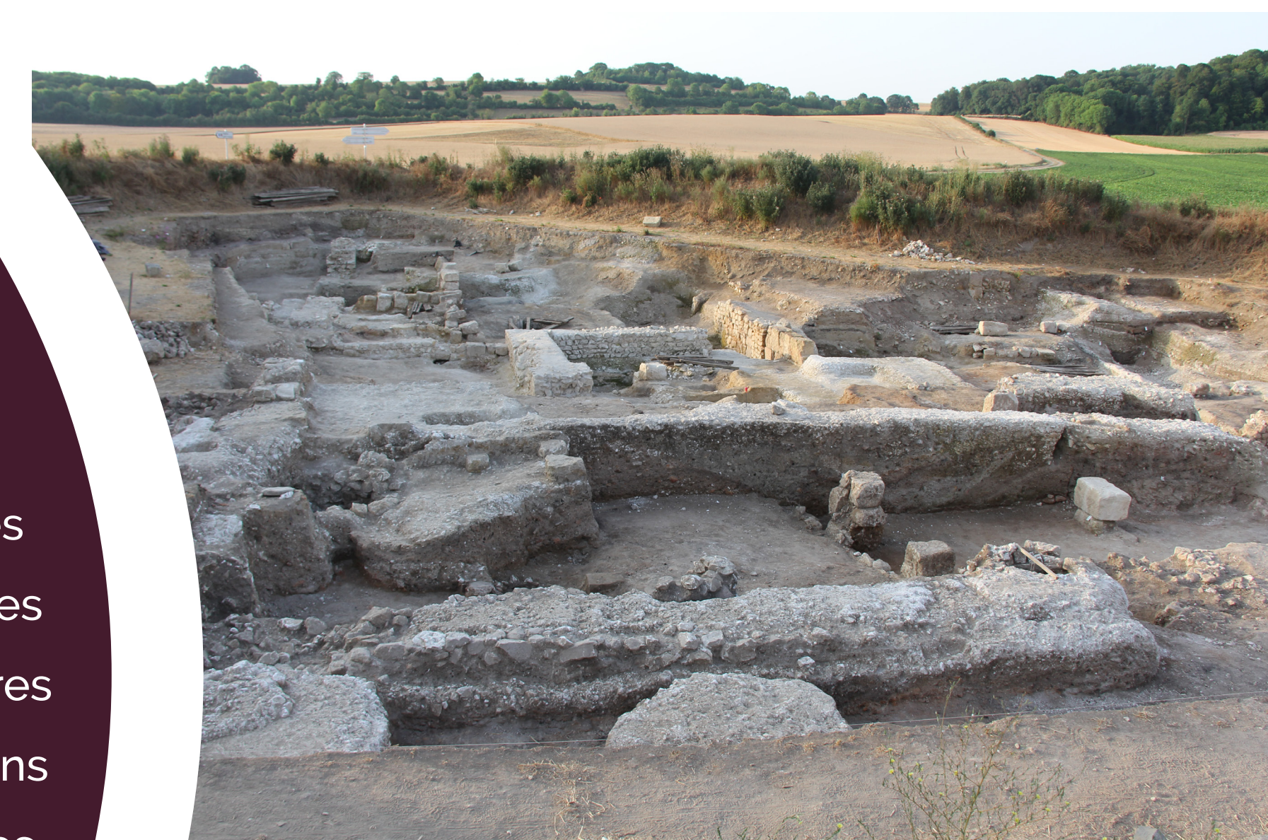
Vue des structures maçonnées (cliché V.Legros)

Les premières occupations de la « Vallée Saint-Denis », datées de vers la fin du règne d'Auguste, sont matérialisées par des structures sur poteaux. À la suite d'un vaste incendie sous le règne de Claude, l'agglomération est rebâtie. Les bâtiments possèdent des fondations en blocs de craie et des murs à pans de bois ou en moellons calcaires. À la fin du I er siècle, une période de construction s'intensifie ( fana , théâtres, sanctuaires et habitats). Vers 170-180, un incendie ravage l'agglomération dont les traces sont observées ailleurs dans la région. Les reconstructions postérieures en pans de bois et torchis reposant sur des plots de récupération, sont moins denses. Le déclin de l'agglomération s'accélère avec les crises économiques et militaires du III e siècle. Le site est encore largement occupé au IV e siècle. Les indices se raréfient après le début du V e siècle. La fouille d'une nécropole de 250 défunts a permis de signaler l'arrivée de migrants venus d'Europe centrale. L'agglomération de Vendeuil-Caply, bien que sur le déclin, constitue encore un pôle fixateur de l'habitat. Les témoignages des siècles suivants sont sporadiques.