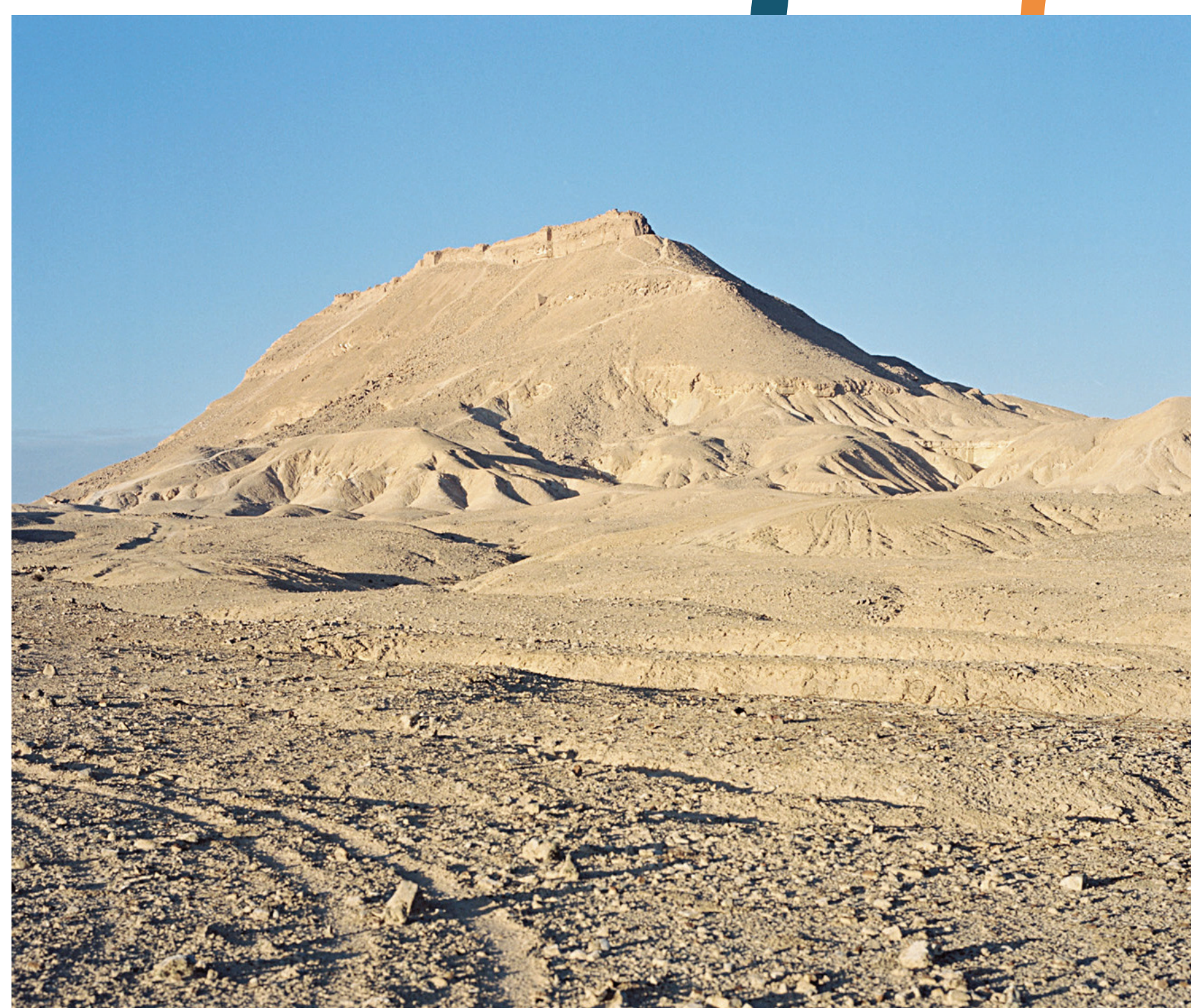
La forteresse de Sadr