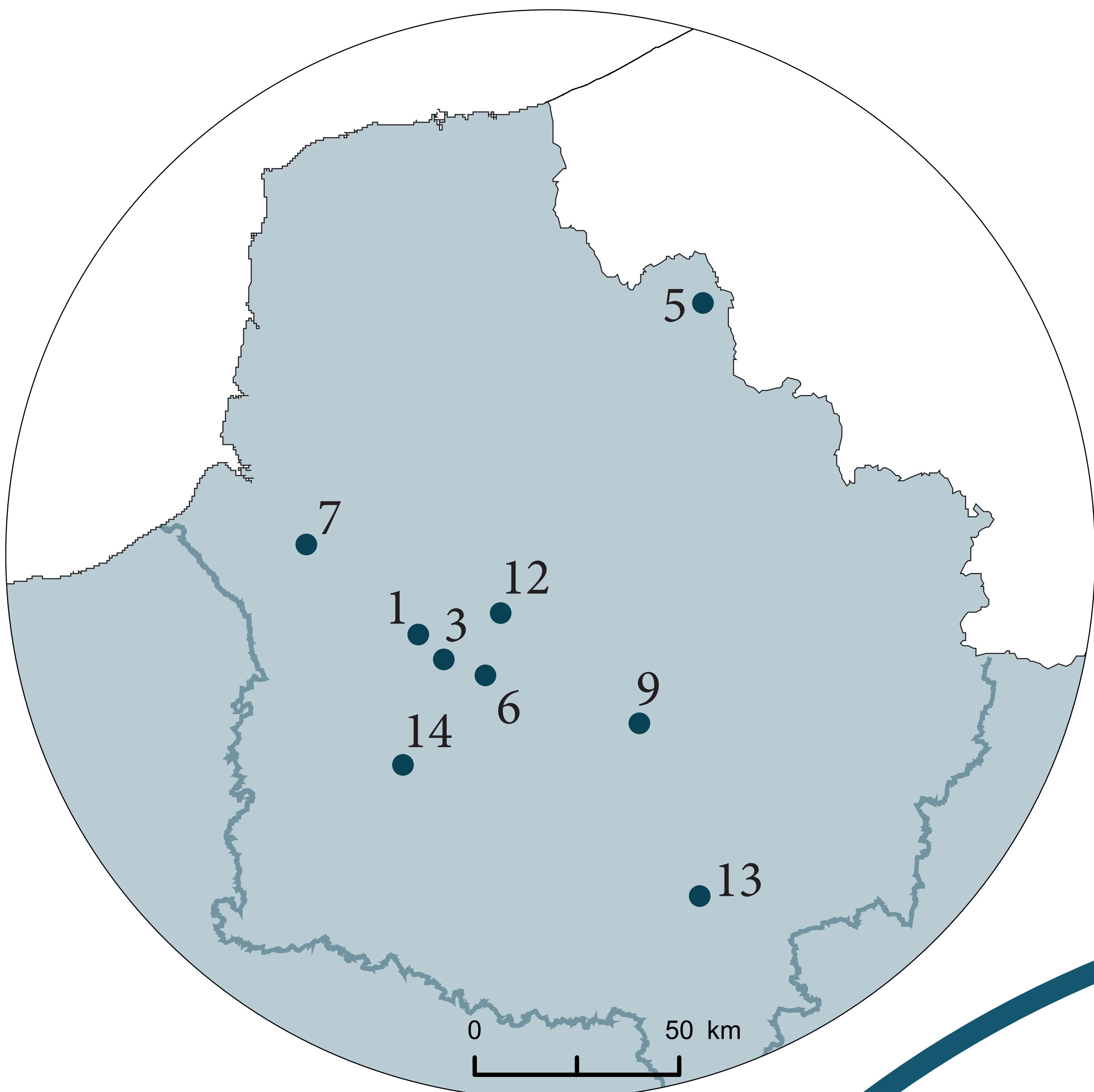
Localisation des sites archéologiques dans le nord de la France (Emilie Gallet - Pauline Augé, Plateforme Humanités Numériques)