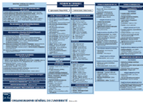
organigramme général (en cours d'actualisation)