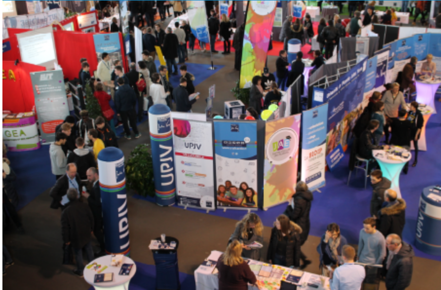
Salon de l'Énergie, l'Électricité et l'Automatisme