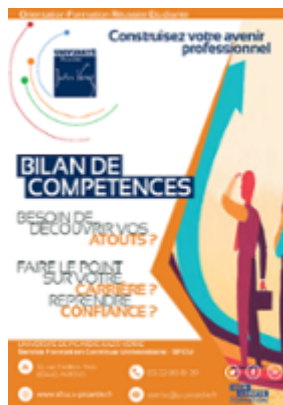
Télécharger le flyer bilan de compétences