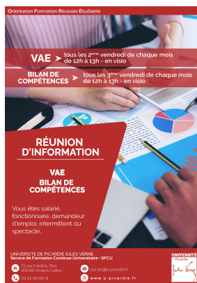
Télécharger l'affiche reunion d'information