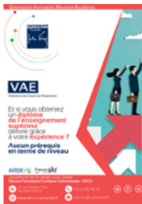
Télécharger le flyer Validation des Acquis de l'Expérience (VAE)