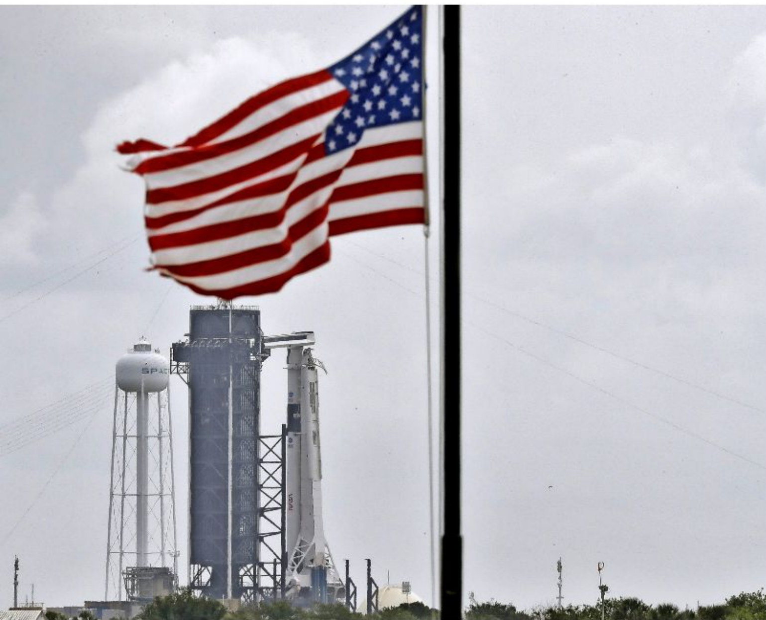
surmontée de la capsule «Crew Dragon», prête au décollage à Cap Canaveral, en Floride.

puis l'arrêt du programme de navettes spatiales en 2011 que les États-Unis ne dépendront plus des Russes pour envoyer des astronautes sur la Station spatiale internationale.