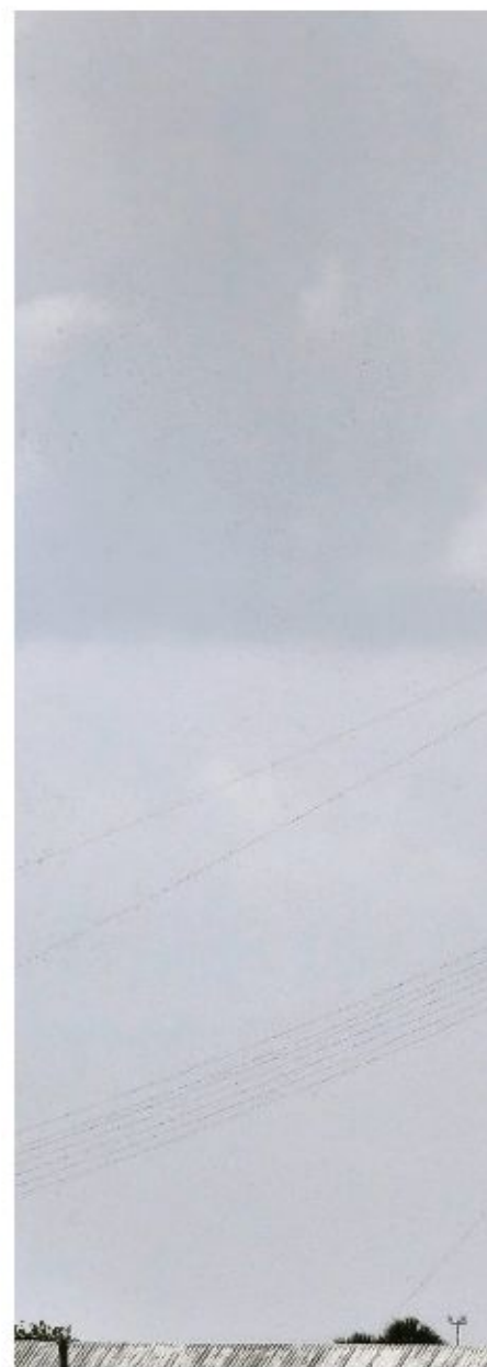
La fusée de Space X «Falcon 9»