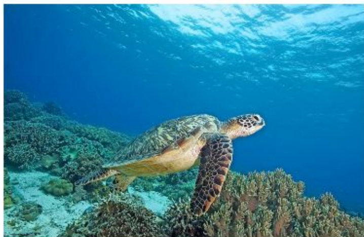
Les espèces marines, comme cette tortue aux Philippines, parcourent toujours plus de kilomètres pour trouver un peu de fraîcheur.

et le développement des villes, freine la capacité des espèces à migrer.