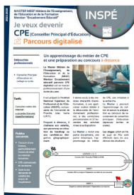
Contenu de la formation