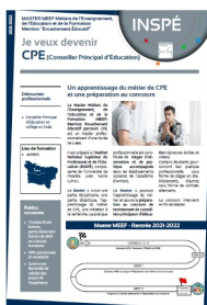
Contenu de la formation