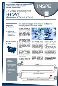
Contenu de la formation