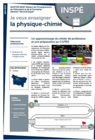
Contenu de la formation