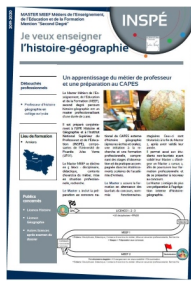
Contenu de la formation