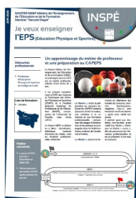
Contenu de la formation

Cette équipe stable, dynamique et complémentaire permet de participer avec la plus grande "exigence bienveillante" à la formation aux CAPEPS et à l'acquisition des compétences professionnelles inhérentes aux métiers de l'enseignement.