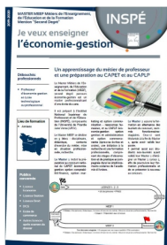
Contenu de la formation