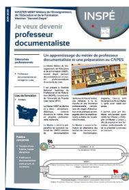
Contenu de la formation