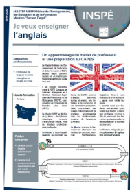
Contenu de la formation