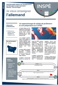
Contenu de la formation