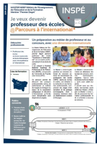
Contenu de la formation