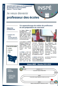
Contenu de la formation